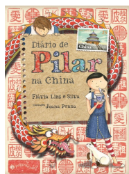
Diário de Pilar na China Silva, Flávia Lins e Ed. Zahar